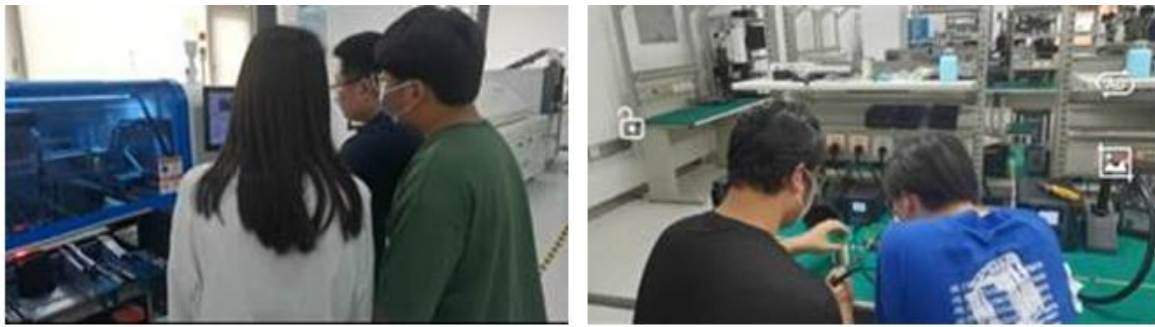
图 6 企业一线工程师实施现场实践教学