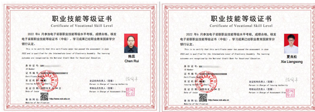
图 7 电子信息工程技术和应用电子技术专业考证通过证书

(2) 快克智能装备股份有限公司销售总监和财务部负责人参与电子创新实验班《电子企业管理》课程教学。校企协同作用下，专业育人水平持续提升，学生眼见和见识开阔了。