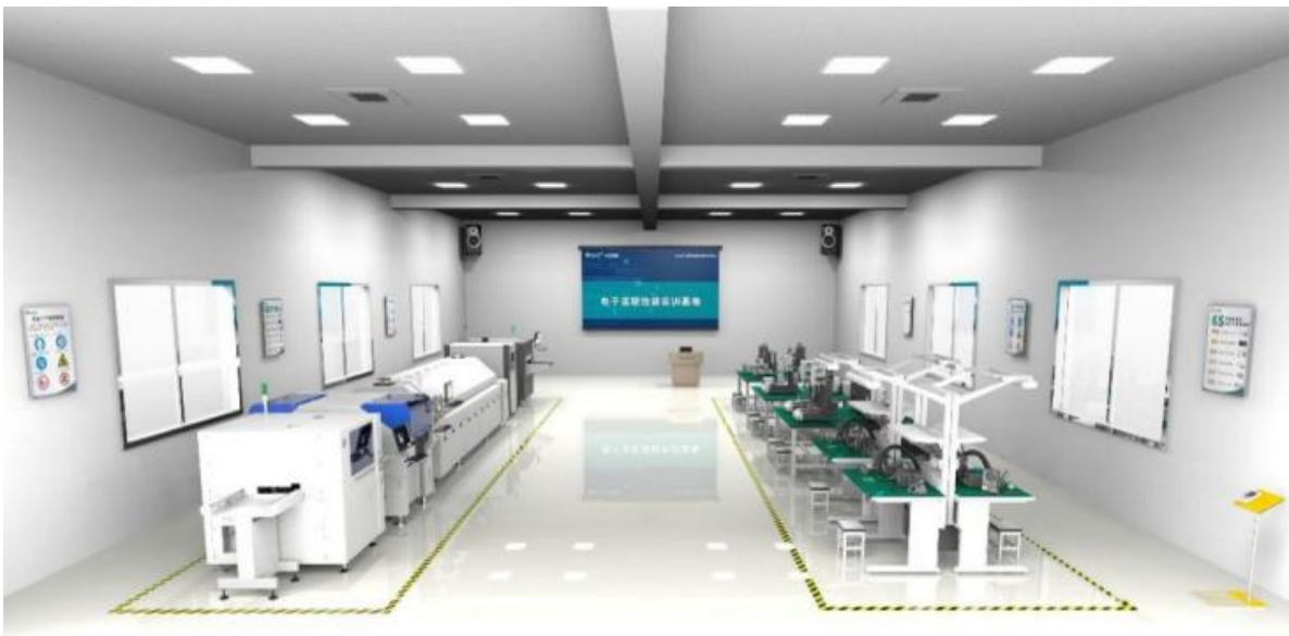
图 1 电子装联技能实训基地

①共同开发基于生产工艺流程的《电子产品生产工艺技术》、《1+X 电子装联初识》的生产类课程资源，开展理、虚、实一体互动教学模式。在校企共建共享共用机制下，围绕 1+X 电子装联职业技能等级标准，整合公司现有的产品设计标准、企业生产工艺文件、人身安全和设备安全的理念、电子装联技能实训基地提升培训资源，按照理论知识、设备操作、质量案例分析和仿真训练一体化的原则进行项目化课程设计和重构，并融入新工艺、新技术、新设备，联合建成 2 门院级在线开放课程，进一步丰富和完善学院现有的专业教学资源。