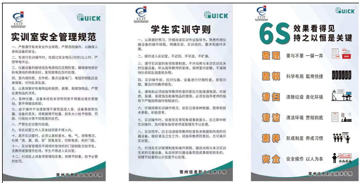
图 5 企业产教事业部协助设计的实训室文化