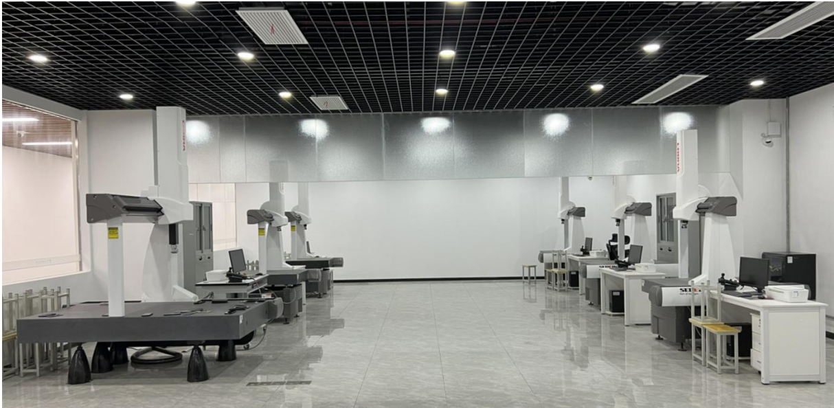
图5 精密检测实训中心实景