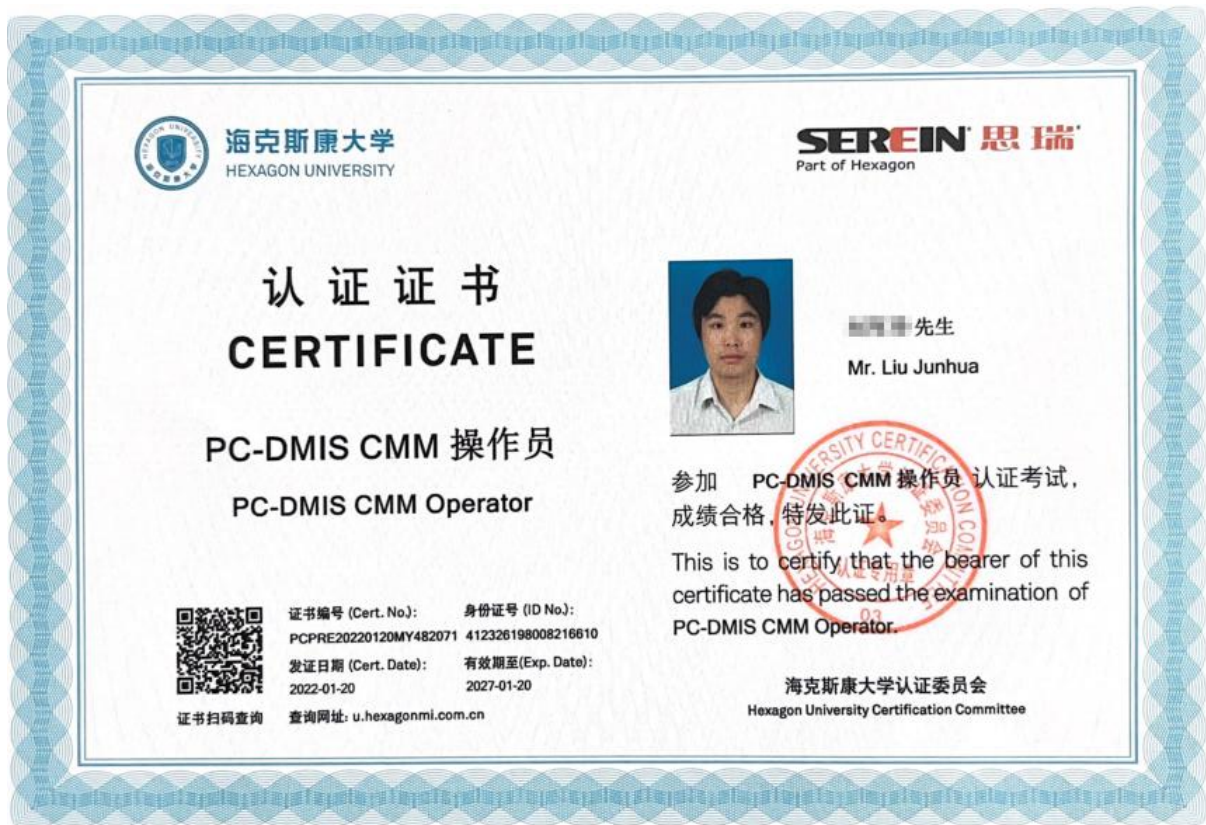
图 7 课证融通的企业认证证书