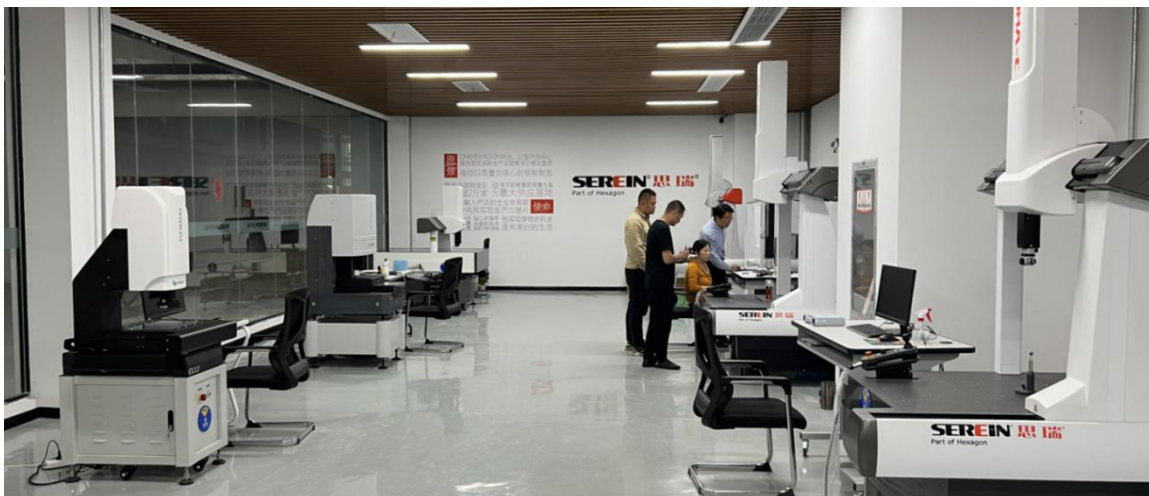
图 4 企业方案中心实景

建设在校内工业互联网大楼的精密检测中心和企业方案中心的装修方案设计和资金主要是由企业提供，累计投入装修资金约 30 万元。