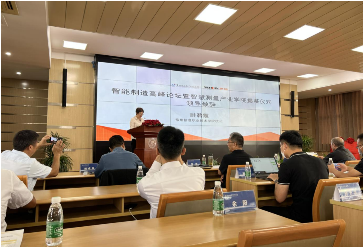
图 1 智慧测量产业学院的揭牌仪式

入，现已实现中心工作的全面开展和合作深入的探索。企业在校内建设了常州方案中心，校企合作共建了思瑞产业学院。在学校建校 60 周年校庆之际，举行了思瑞常州方案中心和智慧测量产业学院的揭牌仪式。