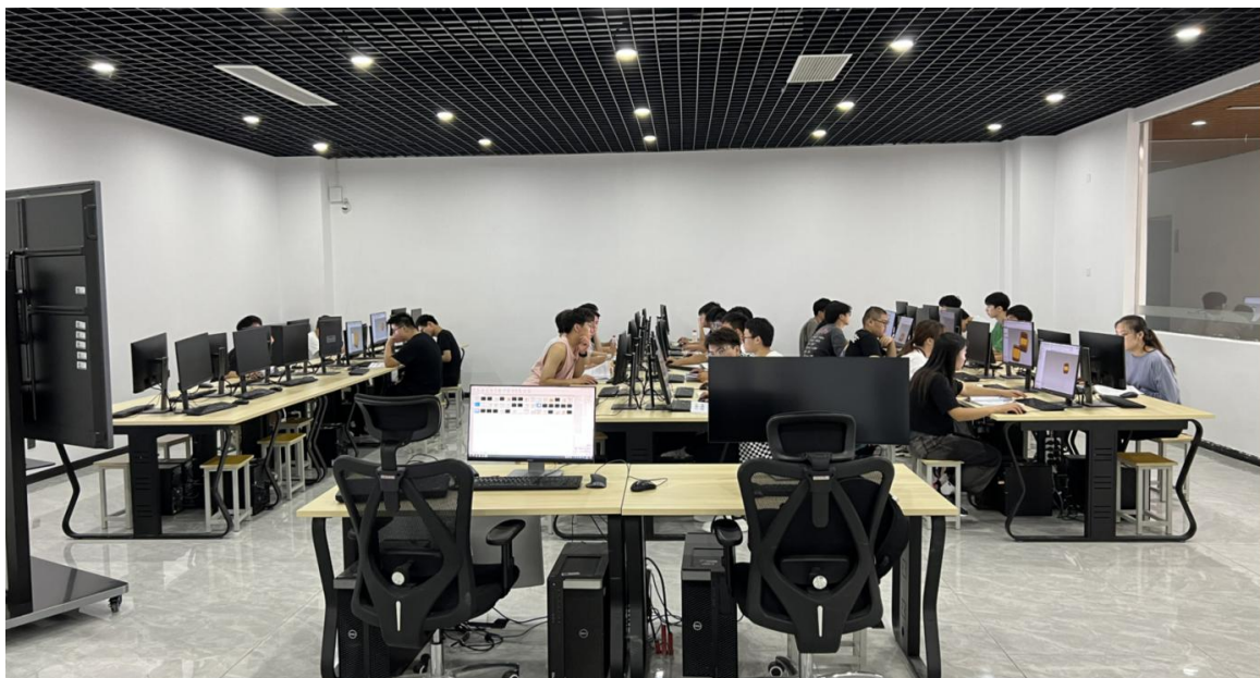
图 2 精密检测虚拟仿真实训中心

探索共建共享“技术领先、形式新颖、可操作性好、方便实用”的检测虚拟仿真实训资源。提升企业的客户培训和学校教学效果。对接 1+X 证书制度、学分银行等相关改革试点任务，探究课证融通机制，实训基地积极有机结合 1+X 证书制度推行试点路径，同时围绕机械检测领域的用工需求和企业员工的特点，开展课程、教材、案例编制，以虚拟仿真平台建设为契机，不断完善和更新现有课程和案例，实现人才培养供给侧和产业需求侧完美对接。现已完成虚拟仿真教学中心机房的建设、企业虚拟仿真软件的捐赠和安装、校本讲义的编写。下一步将积极探索将校本讲义改版，开发项目化的工作手册式、校企共用、公开出版的教材。